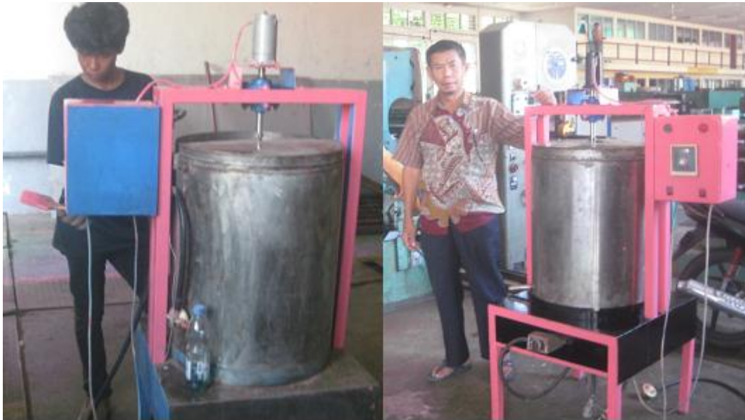
Gambar 2. Foto Mesin Pemasak dan Pengaduk sari buah markisa