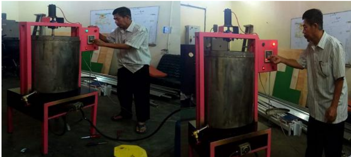
Gambar 3. Foto Kegiatan Pngujian Alat