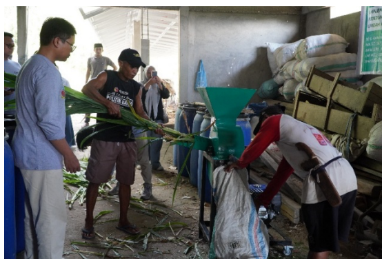
Gambar 5. Uji coba mesin pencacah rumput gajah bersama mitra

Uji coba mesin di lapangan menunjukkan bahwa mesin mampu berfungsi dengan baik sesuai dengan kebutuhan pengguna dan dapat mencacah rumput gajah sebanyak 6–7 kg/menit. Mesin ini tidak hanya efektif