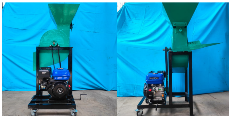
Gambar 4. Mesin pencacah rumput gajah

Berdasarkan hasil pelaksanaan kegiatan pengabdian ini, mesin pencacah rumput gajah yang dirancang dan dibuat telah berhasil mengatasi beberapa permasalahan yang dihadapi peternak di Kota Parepare. Implementasi mesin ini menunjukkan peningkatan efisiensi dalam proses pengolahan pakan ternak, yang sebelumnya dilakukan secara manual menggunakan alat sederhana seperti sabit atau parang. Dengan adanya mesin pencacah, waktu yang diperlukan untuk mencacah rumput gajah menjadi lebih singkat, dan penggunaan tenaga kerja menjadi lebih efisien. Selain itu, potongan rumput yang lebih seragam dan halus meningkatkan daya cerna pakan pada ternak, yang berpengaruh positif terhadap konsumsi pakan dan produktivitas ternak. Pada Gambar 4, dan Gambar 5 ditampilkan secara berturut-turut mesin pencacah rumput gajah, dan uji coba mesin pencacah rumput gajah.