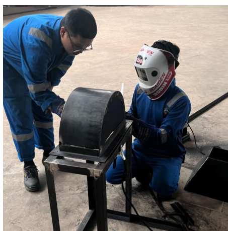
Gambar 3. Proses pembuatan mesin pencacah rumput gajah

Pada tahap pembuatan mesin, desain yang telah dirancang akan direalisasikan dalam bentuk prototipe. Proses pembuatan akan melibatkan penggunaan material yang berkualitas dan sesuai dengan tujuan fungsional mesin. Seluruh komponen akan diproduksi dengan cermat untuk memastikan kekuatan, ketahanan, dan efisiensi dalam penggunaannya. Pada Gambar 3 ditampilkan gambar proses pembuatan mesin pencacah rumput gajah.