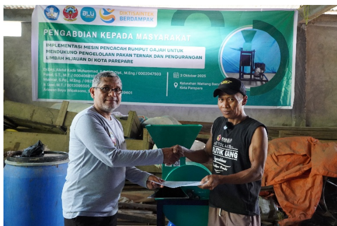
Gambar 6. Serah terima mesin pencacah rumput gajah oleh ketua tim PKM kepada mitra

untuk mencacah rumput gajah, tetapi juga mampu mencampurkan dedak secara bersamaan dengan hasil yang tetap optimal. Keunggulan ini memberikan efisiensi yang signifikan dibandingkan dengan cara manual menggunakan sabit atau parang, yang hanya mampu menghasilkan sekitar 0,18–0,2 kg/menit. Dengan demikian, produktivitas pencacahan meningkat hingga lebih dari tiga puluh kali lipat.