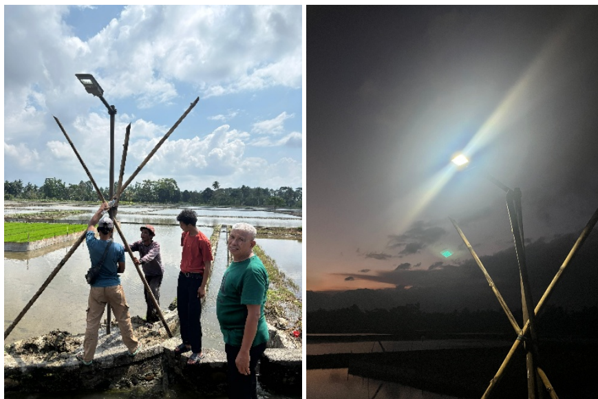
Gambar 2. Instalasi Tiang Lampu

Langkah awal pada gambar 2 tim melakukan pemasangan tiang lampu di area pintu air tersier sebagai salah satu langkah awal dalam meningkatkan fasilitas penerangan bagi masyarakat sekitar. Keberadaan tiang lampu ini diharapkan mampu menunjang aktivitas warga pada malam hari, khususnya dalam menjaga keamanan dan memudahkan akses di sekitar saluran irigasi. Proses instalasi dilakukan secara terencana dengan mempertimbangkan kondisi lapangan agar pemasangan dapat berjalan aman dan sesuai standar.