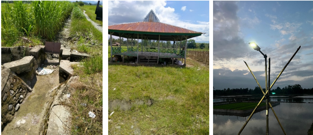
Gambar 1. Kondisi lingkungan sekitar

Permasalahan serupa juga dijumpai di banyak daerah pertanian lain di Indonesia. Sebagai contoh, Kelompok Tani Pari Kesit menghadapi kendala yang sama, di mana petani harus membuka pintu air irigasi tersier pada malam hari tanpa penerangan memadai, hanya mengandalkan senter baterai yang daya tahannya terbatas dan pencahayaannya kurang terang. Aktivitas ini sangat berisiko karena dilakukan di area terbuka dengan kondisi licin dan berlumpur [1].