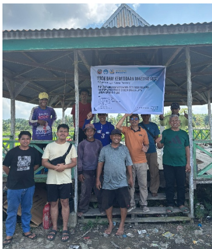
Gambar 4. Pelaksanaan kegiatan pengabdian bersama mitra