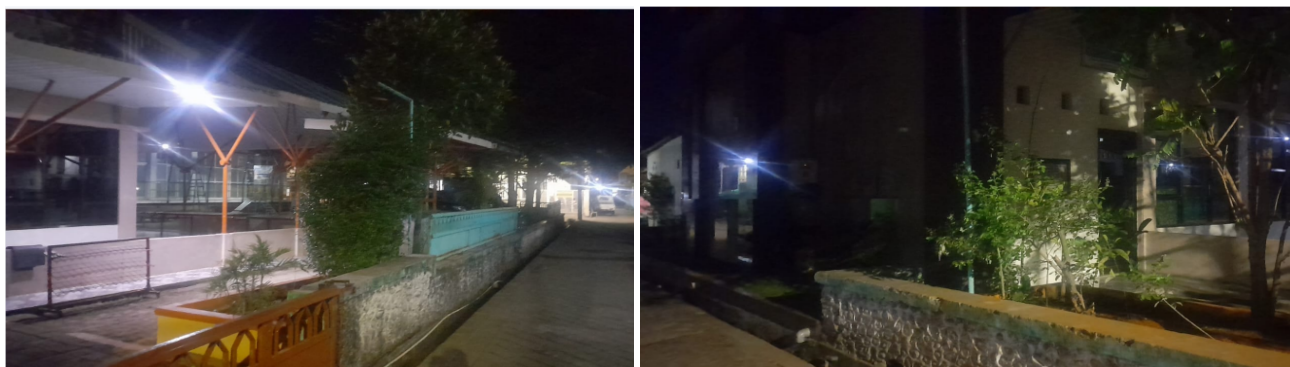
Gambar 1. Kondisi Lingkungan kawasan Masjid Maryam Binti Imran

Kegiatan pengabdian masyarakat ini dilaksanakan melalui beberapa tahapan, antara lain kegiatan survei lokasi untuk menentukan titik pemasangan strategis di sekitar masjid, Perencanaan teknis meliputi pemilihan kapasitas panel surya, baterai, dan lampu LED, Pemasangan tiang dan modul PJU Tenaga Surya pada lokasi yang telah ditentukan, Instalasi lampu LED hemat energi sesuai kebutuhan pencahayaan lingkungan, Pengujian sistem operasi guna memastikan panel surya, baterai, dan lampu berfungsi optimal, serta Pelatihan perawatan sederhana bagi masyarakat setempat agar PJU dapat digunakan secara berkelanjutan. Kondisi lingkungan sekitar Masjid Maryam Binti Imran dapat dilihat pada Gambar 1. Parameter teknis sistem PJU tenaga surya dapat dilihat pada tabel 1.