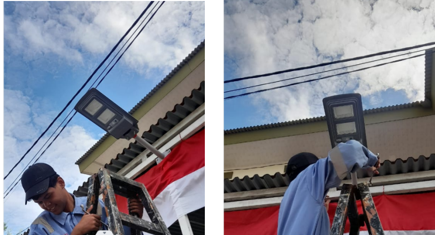
Gambar4. Pelaksanaan pemasangan PJU tenaga Surya

Gambar 4 menunjukkan sebagian proses pemasangan PJU Tenaga Surya di lingkungan sekitar Masjid Maryam Binti Imran dengan melibatkan mahasiswa D4 Teknik Listrik. Titik pemasangan berlokasi pada halaman Masjid Maryam Binti Imran dan jalanan sekitar Masjid. Gambar 5 menunjukkan sebagian dari Tim Pengabdian masyarakat. Tabel 1 menunjukkan hasil pemasangan PJU Tenaga Surya pada area Masjid Maryam Binti Imran.