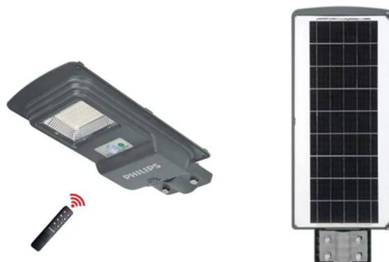
Gambar 3. Spesifikasi Essential SmartBright 100 W (1000 Lumens)