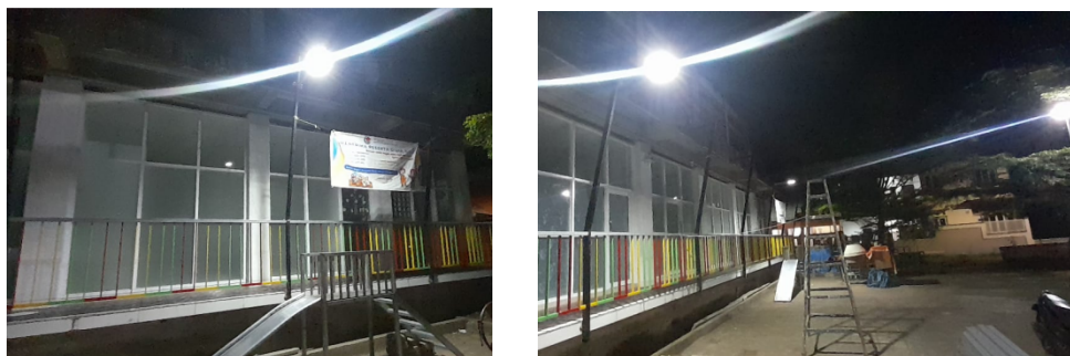
Gambar 6. Kondisi pencahayaan pada halaman setelah pemasangan PJU Tenaga Surya

Pencahayaan yang dihasilkan tidak hanya membantu aktivitas warga pada malam hari, tetapi juga menciptakan rasa aman dengan mengurangi risiko area gelap yang rawan bahaya. Pantulan cahaya pada dinding bangunan dan vegetasi di sekitar lokasi menegaskan bahwa lampu hemat energi (LED) yang terpasang mampu bekerja optimal, meskipun berada dalam kondisi malam yang minim penerangan alami.