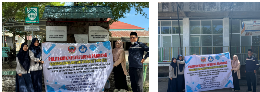
Gambar 5. Tim Pelaksana pemasangan PJU Tenaga Surya