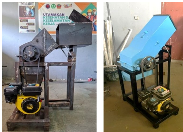
Gambar 2. Pengembangan perancangan mesin pencacah es balok

Seluruh komponen dirakit menjadi satu sistem, termasuk penambahan pengunci pada saluran masuk untuk mempermudah pemasukan es balok.