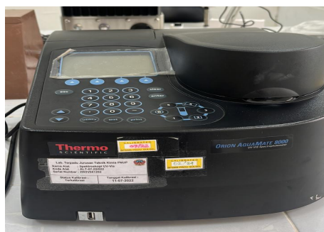
Gambar 3. Alat Spektrofotometer Uv-Vis

Pada gambar 2. Aliran dari tangki penampungan menuju kolom biosorpsi yang terdiri dari bagian penyaring yang berisi bioball yang berfungsi untuk menyaring pengotor-pengotor kasar yang ada pada air limbah, kemudian bagian adsorben yaitu kulit buah kakao dan arang aktif ditambakan spons dan kapas yang berfungsi untuk menyaring air limbah agar menghasilkan produk yang lebih jernih. Sistem dijalankan secara kontinu dengan air limbah yang mengandung logam Fe sebagai sampel, dialirkan melalui kolom biosorpsi. Secara visual terlihat perbedaan antara sampel awal dan produk, di mana produk tampak lebih jernih. Hal ini menjadi indikasi awal bahwa proses biosorpsi telah berlangsung di dalam kolom biosorben, Pengukuran absorbansi sampel dilakukan dengan analisa kuantitatif menggunakan Spektrofotometer Uv-Vis, alat Spektrofotometer Uv-Vis ditunjukkan pada gambar 3.