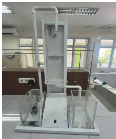
Gambar 1. Alat Biosorpsi Logam Berat

Tahap Perakitan. Perakitan alat dilakukan di bengkel Teknik Kimia dengan menggunakan material utama berupa akrilik transparan, pipa PVC, dan pompa peristaltik. Alat terdiri atas: (a) Tangki penampungan limbah, berfungsi sebagai wadah awal air limbah. (b) Pompa peristaltik, sebagai penggerak utama untuk mengalirkan air dengan kontrol laju alir. (c) Kolom adsorpsi yang terdiri dari bagian penyaring yang berisi bioball untuk menyaring partikel kasar dan mencegah penyumbatan dan bagian biosorben yang berfungsi sebagai inti proses biosorpsi yang akan diisi dengan biosorben. (d) Tangki produk, sebagai penampungan air hasil biosorpsi. Hasil perakitan alat ditunjukkan pada Gambar 1. di bawah yang memperlihatkan prototipe alat biosorpsi dengan sistem aliran dari tangki penampungan sampel air limbah menuju kolom biosorpsi yang terdiri dari bagian penyaring, dilanjutkan ke bagian biosorben, dan yang terakhir ke tangki produk.