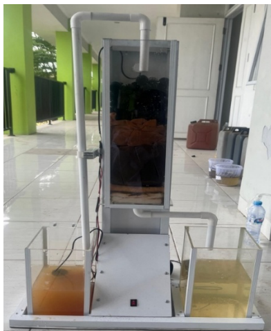
Gambar 2. Proses Biosorpsi Sampel Limbah Logam Fe

menurunkan konsentrasi larutan dalam hal ini adalah larutan sampel yang mengandung logam Fe pada sampel air limbah.