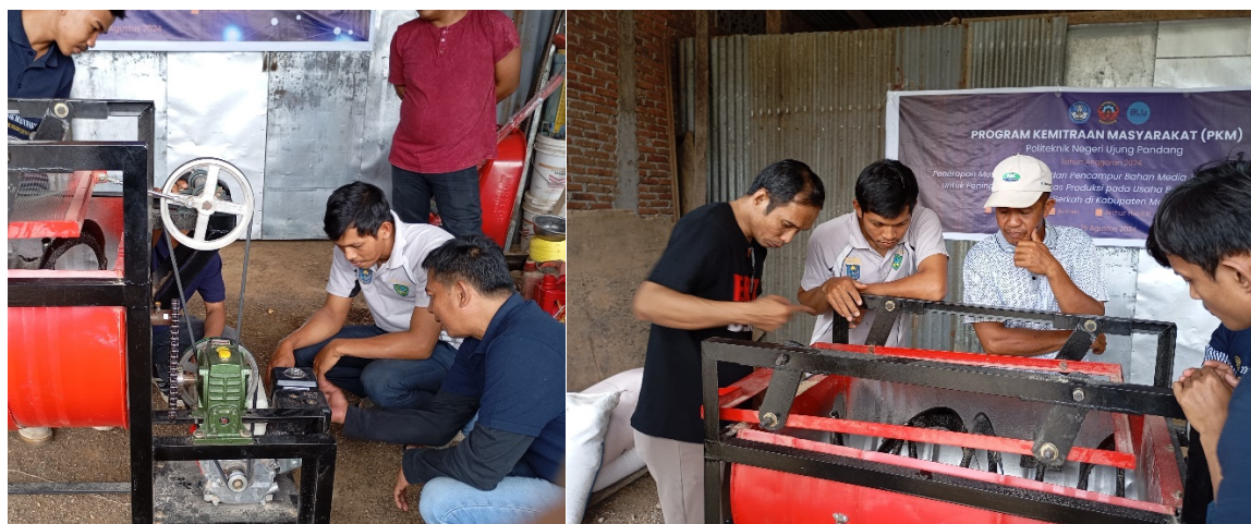
Gambar 3. Pelaksanaan demonstrasi dan penjelasan prinsip kerja mesin, uji coba mesin serta penyerahan mesin kepada mitra

Gambar 3 menunjukkan suasana penjelasan teknis prinsip kerja mesin, cara pengoperasian serta perawatan yang dibutuhkan serta penyerahan produk kepada mitra. Dari hasil pelaksanaan kegiatan ini, mitra dapat meningkatkan kapasitas Produksi menjadi telah mampu menghasilkan campuran yang homogen, sehingga diperoleh kapasitas pengayakan dan pencampuran maksimum sebesar 372 kg/jam.