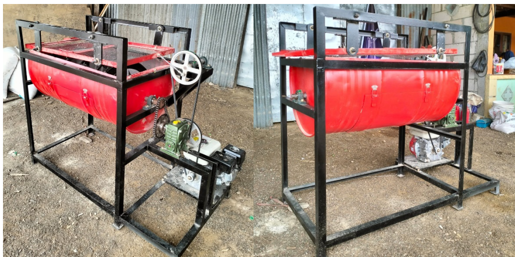
Gambar 2. Mesin Pengayak dan Pencampur Media Tanam Jamur Tiram

Mesin yang diterapkan pada kegiatan ini adalah mesin pengayak dan pencampur bahan media tanam jamur tiram yang merupakan hasil desain, pengembangan dan Pembuatan mesin yang dilaksanakan di Jurusan Teknik Mesin Politeknik Negeri Ujung Pandang sebagaimana terlihat pada Gambar 2.