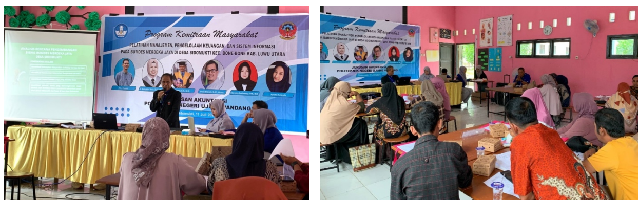
Gambar 3. Penyajian Materi Sosialisasi BUMDes, Rencana Pengembangan Usaha BUMDes Merdeka Jaya dan Diskusi Kelompok

Pada kegiatan pengabdian ini, disajikan lima materi yang dilengkapi dengan latihan. Kelima materi tersebut adalah: Sosialisasi tentang BUMDes, Rencana Pengembangan Bisnis BUMDes Merdeka Jaya, Penyusunan Business Plan BUMDes, Penyusunan Laporan Keuangan BUMDes, serta Sistem Informasi Keuangan. Penyajian materi diawali dengan Materi Sosialisasi BUMDes dan Rencana Pengembangan Bisnis BUMDes Merdeka Jaya dimana Ruang lingkup materi yang disajikan meliputi: Pengertian BUMDes dan beberapa dasar hukum tentang BUMDes, serta pemberian beberapa contoh BUMDes yang sukses. Kemudian penyajian materi tentang rencana pengembangan bisnis BUMDes Merdeka Jaya yang dilanjutkan dengan latihan tentang rencana pengembangan bisnis BUMDes Merdeka Jaya. Pada latihan ini, peserta dibagi ke dalam lima kelompok, yaitu Kelompok 1, Kelompok 2, Kelompok 3, Kelompok 4, dan Kelompok 5. Setiap kelompok melakukan diskusi (Gambar 3) dan mempresentasikan hasil kerja kelompoknya. Dari sesi ini menghasilkan delapan usulan pengembangan unit usaha untuk BUMDes Merdeka Jaya sebagaimana ditunjukkan pada tabel 1. Usulan pengembangan unit usaha ini akan ditindaklanjuti oleh pengelola BUMDes Merdeka Jaya