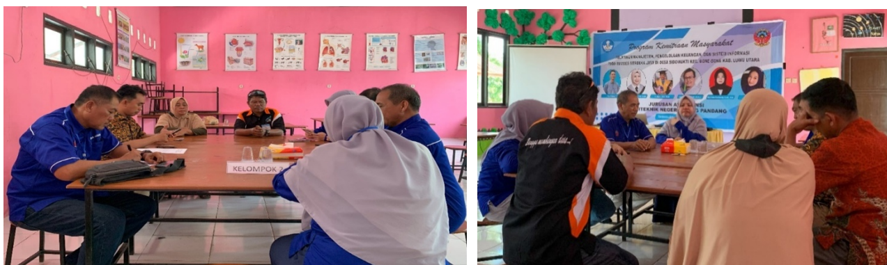
Gambar 4. Focused Group Discussion

Selanjutnya dilakukan focused group discussion (FGD) yang melibatkan kepala Desa, sekretaris desa, serta pengurus BUMDes.