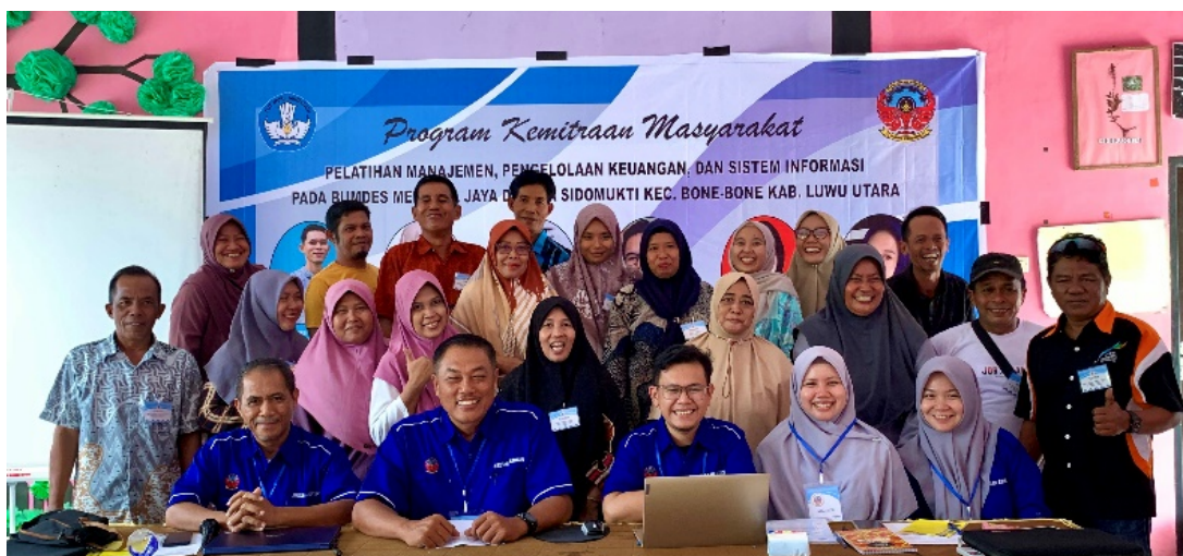
Gambar 2. Peserta Pelatihan dan Tim

Kegiatan ini dihadiri peserta sebanyak 21 orang yang terdiri dari Pengelola BUMDes Merdeka Jaya, Aparatur Desa Sidomukti, dan perwakilan masyarakat Desa Sidomukti sebagaimana ditunjukkan pada Gambar 2.