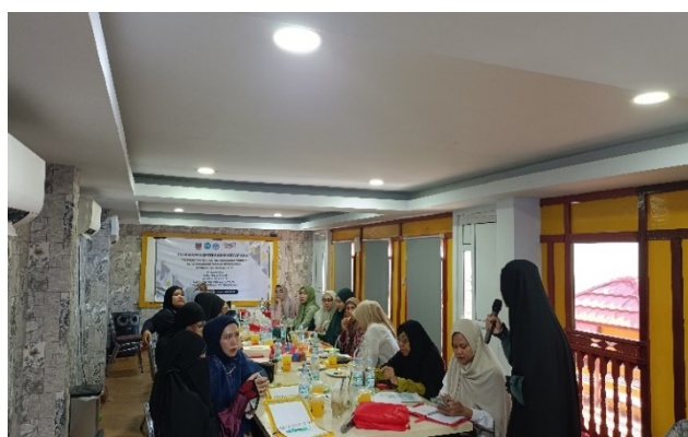
Gambar 3. Pelaksanaan Kegiatan Pelatihan Optimalisasi Keuangan Usaha bagi Pelaku Usaha Mikro