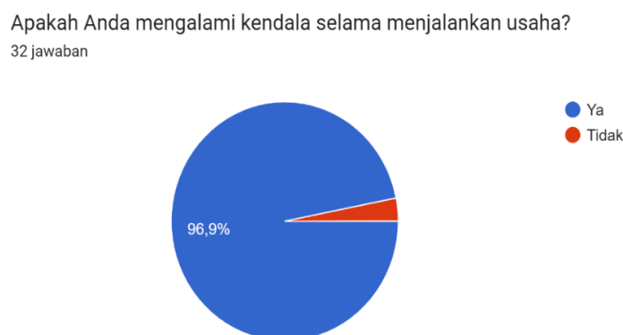
Gambar 1. Persentase Pelaku Usaha yang Menghadapi Kendala dalam Pengelolaan Keuangan

Saat ditelusuri lebih lanjut kendala yang dihadapi dalam pengelolaan keuangan usahanya, umumnya jawaban yang muncul adalah: (1) kurang paham mengenai pengelolaan keuangan, (2) belum mampu memisahkan keuangan bisnis dan pribadi, (3) belum memiliki rekening usaha, (4) minimnya modal usaha dan untuk mengelola modal usaha tersebut menjadi lebih baik, (5) sulit mengatur cash flow, (6) modal dirasakan sulit kembali (break even point), (7) sulit mendapatkan keuntungan, (8) masih belum bisa mengelola keuangan dengan baik karena usaha masih dikerjakan sendiri sehingga ada keterbatasan waktu antara produksi dan pencatatan keuangan, (9) belum menemukan aplikasi yang pas untuk keuangan bisnis, dan (10) kenaikan harga bahan baku yang melambung tinggi.