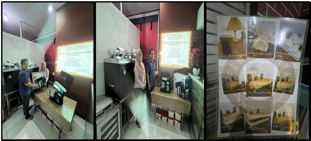
Gambar 2. Dokumentasi Program PKM

Adapun dokumentasi kegiatan PKM yang telah dilakukan dapat ditampilkan sebagai berikut: