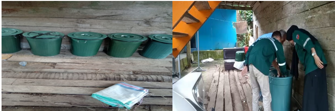
Gambar 5. Fermentasi