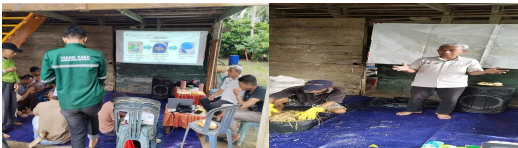
Gambar 2. Pemaparan kegiatan PKM

Pelatihan pembuatan pakan fermentasi ini dilakukan dengan beberapa tahap yaitu: