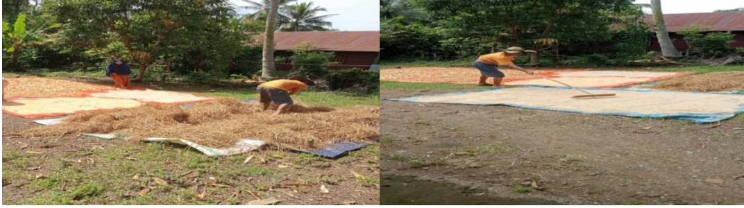
Gambar 4. Pengeringan bahan