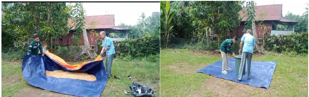
Gambar 6. Penjemuran hasil fermentasi