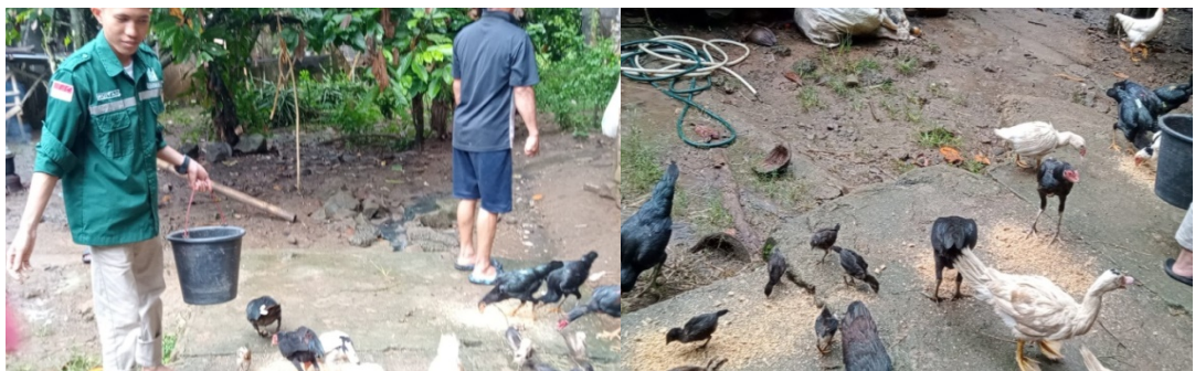
Gambar 7. Pengaplikasian pakan fermentasi ke ternak ayam