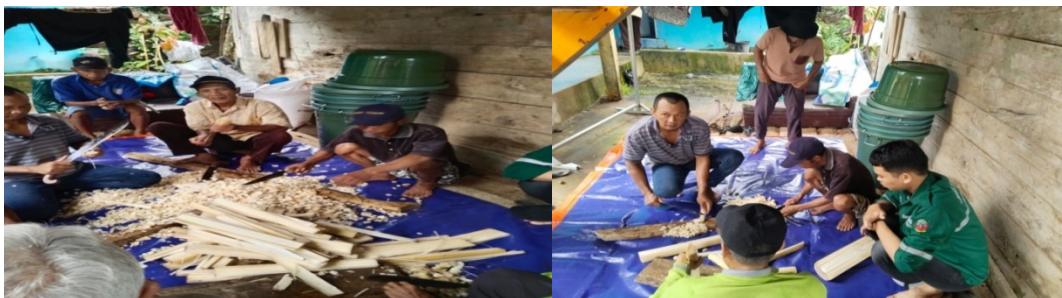
Gambar 3. Persiapan alat dan bahan kegiatan

Penjelasan mengenai manfaat jagung kuning, dedak padi, dan batang jagung sebagai bahan baku pembuatan pakan fermentasi untuk ayam kampung dan cara pembuatan pakan fermentasi.