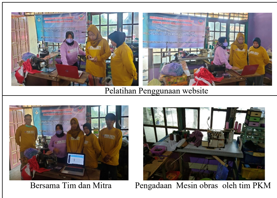
Gambar 3. Pelaksanaan Pelatihan Penggunaan website

Kegiatan pelatihan penggunaan website kepada mitra dilaksanakan selama satu hari, dengan jumlah anggota tim mitra 2 orang. Pelatihan ini dilaksanakan agar mitra senantiasa selalu memberikan informasi yang terkini kepada pelanggan dan calon pelanggan. Ada banyak fitur pada website yang dibuat (seperti yang sudah di jelaskan di atas), bisa memudahkan pelanggan untuk berhubungan dengan mitra. Kegiatan ini juga memberikan mesin jahit obras/jahit pinggir yang telah diserahkan kepada mitra.