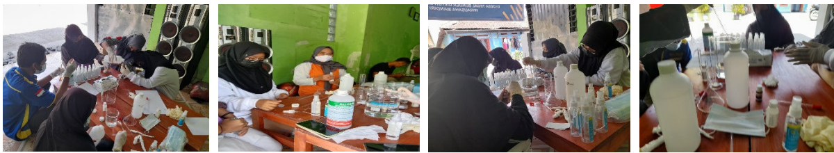
Gambar 4. Pelatihan pembuatan hand sanitizer di Desa Tegal Bunder

Hasil dari kegiatan ini adalah berupa produk hand sanitizer yang diproduksi menggunakan bahan alami yang sangat aman untuk digunakan, yaitu dari ekstrak daun sirih. Produk hand sanitizer yang dihasilkan kemudian dikemas dalam botol semprot supaya lebih mudah saat digunakan. Gambar 5 menunjukkan produk hand sanitizer yang berhasil dibuat oleh masyarakat Desa Tegal Bunder.