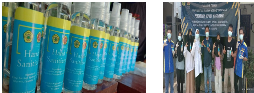
Gambar 5. Produk hand sanitizer dalam kemasan semprot

Hasil dari kegiatan ini adalah berupa produk hand sanitizer yang diproduksi menggunakan bahan alami yang sangat aman untuk digunakan, yaitu dari ekstrak daun sirih. Produk hand sanitizer yang dihasilkan kemudian dikemas dalam botol semprot supaya lebih mudah saat digunakan. Gambar 5 menunjukkan produk hand sanitizer yang berhasil dibuat oleh masyarakat Desa Tegal Bunder.