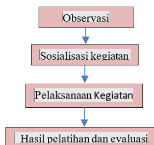
Gambar 2. Tahapan Kegiatan

Metode yang digunakan dalam pelaksanaan kegiatan ini adalah kombinasi antara difusi ipteks dan pelatihan. Metode difusi ipteks karena program ini menghasilkan produk berupa hand sanitizer untuk menangani lonjakan kasus Covid-19. Dalam proses transfer informasi digunakan metode pelatihan, dimana dilakukan penyuluhan tentang proses pembuatan hand sanitizer dari tim UNTIRTA kepada masyarakat Desa Tegal Bunder dengan demonstrasi dan percontohan. Dalam kegiatan ini, hand sanitizer yang dibuat hanya menggunakan akuades sebagai pelarutnya, dan jenis tanaman yang digunakan sebagai zat aktifnya adalah daun sirih. Tahapan pelaksanaan program yaitu meliputi: sosialisasi program, pelatihan pembuatan produk hand sanitizer dengan bahan aktif tanaman herbal, pengemasan produk, pemantauan program, hingga pelaporan. Metode pelaksanaan kegiatan pelatihan hand sanitizer secara garis besar dapat dilihat pada Gambar 2 berikut: