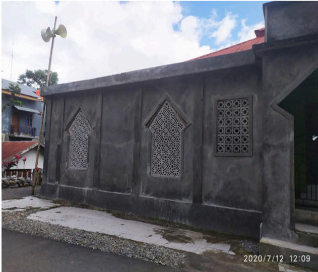
Gambar 1 Kondisi Masjid Sebelum Pengecatan