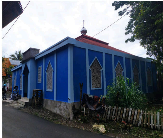
Gambar 2 Kondisi Masjid Sesudah Pengecatan