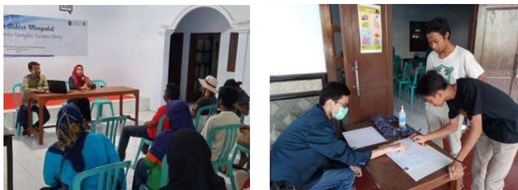
Gambar 4. Pelatihan pemasaran online

Permasalahan utama yang dihadapi oleh Petani di Desa Bocek adalah jatuhnya harga cabai saat panen. Masalah ini dapat diakali dengan adanya BUMDes yang mampu dijadikan sebagai wadah sekaligus hasil panen cabai untuk dijual di pasar. Pada awal acara pelatihan, tim DM membagikan Hand Sanitizer dan masker bagi peserta pelatihan yang hadir sebagai bentuk kepedulian kondisi pandemi saat ini. Berbagai pertanyaan dan masukan dalam pengembangan dan pemasaran produk pertanian disampaikan oleh masyarakat Desa Bocek dalam acara Pelatihan Pemasaran tersebut.