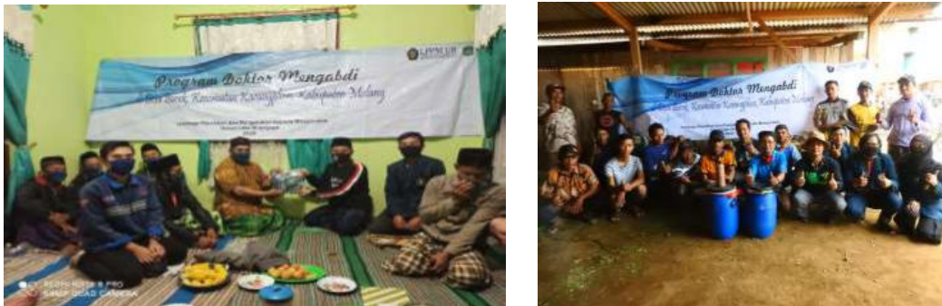
Gambar 2. Kegiatan sosialisas dan pelatihan pakan silase

Ciri-ciri silase yang baik adalah warna hijaunya masih terlihat jelas dan memiliki aroma khas yang tidak busuk, selain itu tekstur dari silase bertekstur lembut serta bila dikepalkan, silase tidak mengeluarkan air. Kelebihan dari silase adalah pengawetan dilakukan dalam kondisi basah sehingga lebih disukai ternak dibandingkan dengan pengawetan dengan cara kering. Pemberian silase pada ternak sebaiknya perlu dilatih terlebih dahulu dengan cara diberikan sedikit demi sedikit untuk membiasakan ternak dengan pakan yang baru karena sebelumnya sudah terbiasa diberikan hijauan.