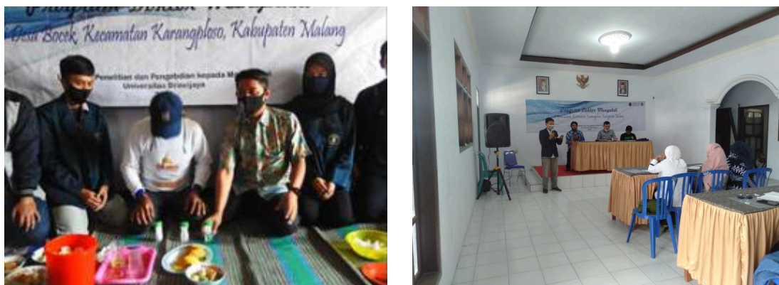
Gambar 1. Kegiatan Sosialisasi dan Pelatihan BUMDes Bocek, Karangploso, Malang

Salah satu permasalahan yang dialami oleh masyarakat Desa Bocek adalah belum maksimalnya pemanfaatan potensi yang dimiliki oleh desa dan hasil panen yang terkadang tidak terserap seluruhnya oleh pasar dan jatuhnya harga saat panen. Permasalahan tersebut dapat diatasi dengan adanya BUMDes yang mampu sebagai penadah sekaligus distributor hasil panen untuk dijual ke beberapa segmentasi pasar. Sosialisasi yang dilakukan oleh tim Doktor Mengabdikan tentang pembentukan BUMDes Desa Bocek diharapkan mampu memberikan pemahaman kepada masyarakat tentang fungsi dan tujuan pembentukan BUMDes.