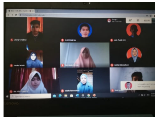
Gambar 2. Sesi 1 Pelatihan melalui Google Meeting

Pada kegiatan pengabdian ini, materi yang diberikan diawal berupa pendahuluan mengenai bagaimana dan apa yang dimaksud dengan media pembelajaran berbasis TIK. Selanjutnya di paparkan mengenai pentingnya media pembelajaran dalam kegiatan PBM daring yang menjadi metode utama PBM selama kondisi pandemik.