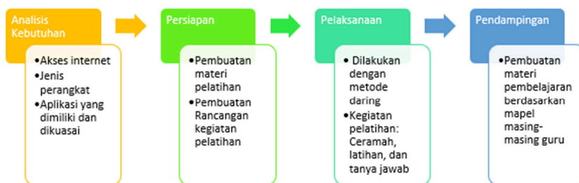
Gambar 1. Metode Pelaksanaan Kegiatan PKM

Kegiatan Pengabdian kepada Masyarakat (PKM) ini dilaksanakan dalam bentuk pelatihan bagi guru SMP Negeri 1 maros untuk mengembangkan keterampilan mereka akan media pembelajaran kreatif yang berbasis TIK. Kegiatan ini dilaksanakan dalam empat tahap, yaitu analisis kebutuhan, proses persiapan, proses pelaksanaan, dan pendampingan. Gambar 1 menunjukkan tahapan pelaksanaan kegiatan PKM ini.