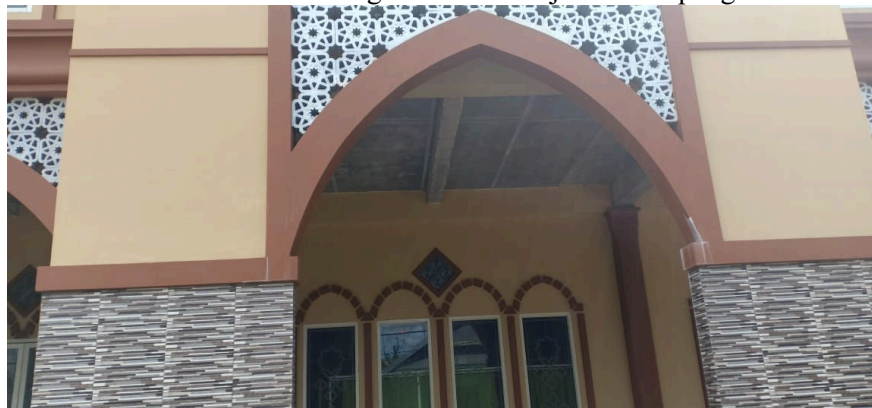
Gambar. Kondisi Masjid Setelah Pengecatan