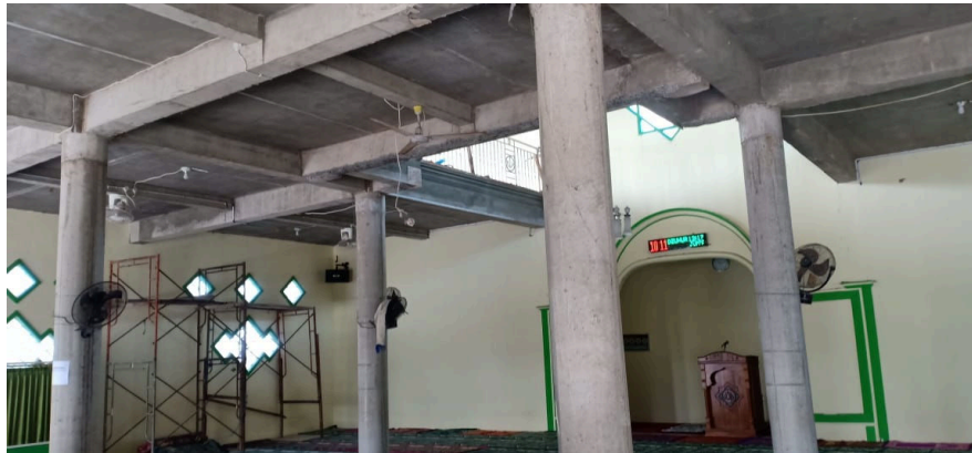
Gambar 1. Rencana lokasi untuk pengecatan masjid