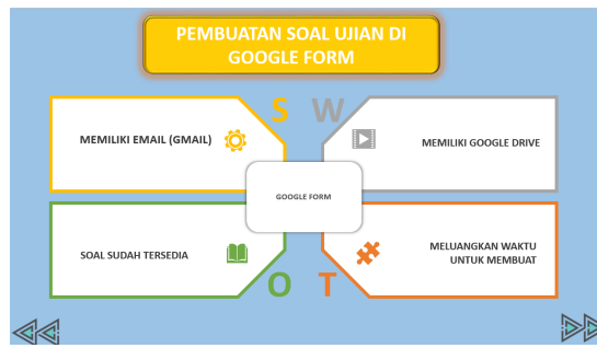
Gambar 4. Pembuatan Soal ujian di google form