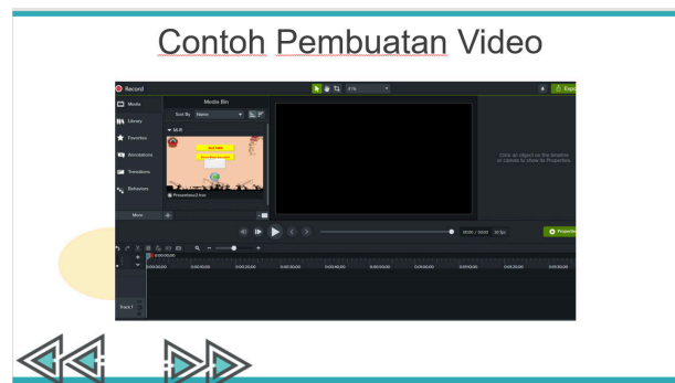
Gambar 8. Contoh Pembuatan video pembelajaran