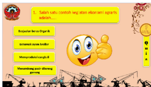
Gambar 3 Quiz interaktif

Kemudian kegiatan di lanjutkan dengan Pembuatan ulangan harian dengan memanfaatkan google form. Adapun mekanisme pembuatan dilakukan dengan tahapan-tahapan berikut: