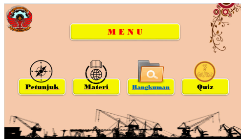
Gambar 2. Desain power point interaktif