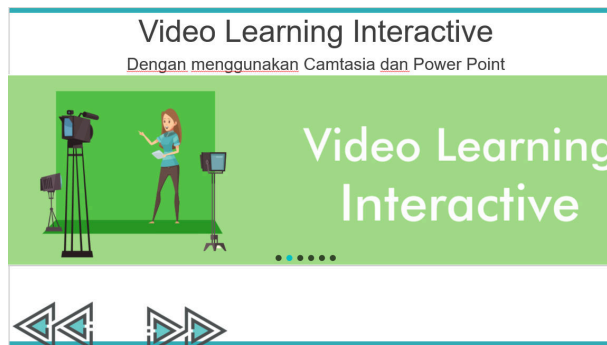
Gambar 7. Tahapan pembuatan video pembelajaran

Aktivitas terakhir yang dilakukan, adalah bagaimana membuat video pembelajaran, sehingga anak didik dapat mempelajari materi menggunakan perangkat komputer atau handphone, sesuai waktu luang anak didik. Adapun tahapan pembuatan dan contoh hasil yang diperlihatkan adalah sebagai berikut: