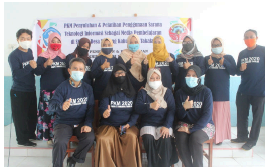
Gambar 1. Foto bersama peserta

Dari pelatihan pertama, yakni membuat power point interaktif, diperoleh antusias dari guru-guru yang ikut, dengan mengikuti semua kegiatan yang dilakukan. Adapun foto-foto kegiatan dan hasil yang di peroleh adalah sebagai berikut :