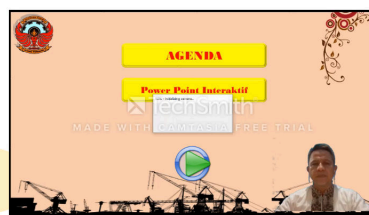
Gambar 9. Hasil Akhir pembuatan video pembelajaran

Dari tiga (3) kegiatan yang dilakukan, yang paling sulit diikuti adalah pembuatan video pembelajaran, ini disebabkan perangkat computer/laptop yang dimiliki oleh guru-guru, memiliki memori yang rendah. Sehingga kesulitan saat menjalankan software Camtasia, sehingga dominan mendemokan proses pembuatan video pembelajaran. Namun aktivitas desain power point interaktif dan pembuatan soal menggunakan google form dapat dilakukan.