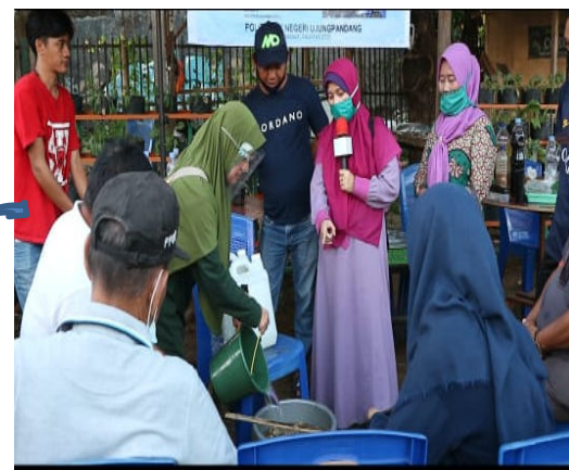
Gambar 10. Penambahan air