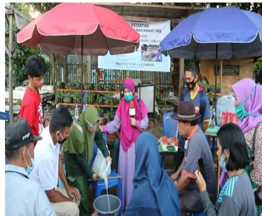
Gambar 8. Pencampuran nutrisi air pencucian beras