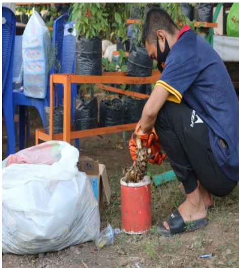
Gambar 5. Proses pencacahan

Pembuatan pupuk organik (cair dan padat) dengan bahan baku sampah-sampah organik berupa sampah sayuran dan kulit nanas yang diperoleh dari warga setempat. Proses pembuatan pupuk organik dimulai dengan mencacah bahan-bahan sayuran, kulit nanas yang sudah agak kering (kadar air sekitar 30 - 45%) (gambar 5), dan pencampuran nutrisi yang lain yakni air kelapa, air pencucian beras (gambar 7 dan 8) serta penambahan bahan aktivator berupa EM4 (gambar 9). Bahan-bahan ini dicampur dengan perbandingan tertentu yang kemudian ditempatkan pada alat komposter (gambar 10).