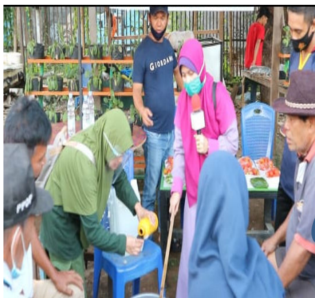
Gambar 9. Pencampuran EM4