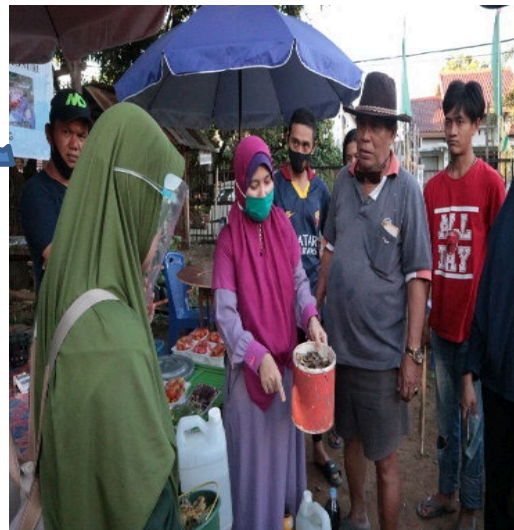
Gambar 6. Proses pencampuran bahan organik