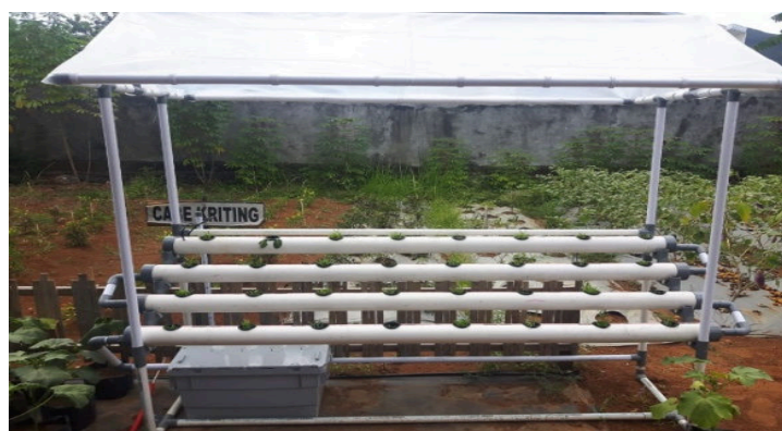
Gambar 11. Penanaman bibit kangkung pada alat hidroponik

Penggunaan alat hidroponik sebagai sarana bercocok tanam sangat efektif dilakukan pada lahan yang terbatas seperti di daerah perkotaan. Alat hidroponik dilengkapi dengan sarana pendukung seperti rockwool media tanam hidroponik, netpot hidroponik, pompa sirkulasi nutrisi, bak penampung nutrisi. Salah satu model alat hidroponik dapat dilihat pada gambar 11.