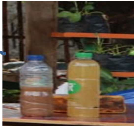
Gambar 4. Produk MOL