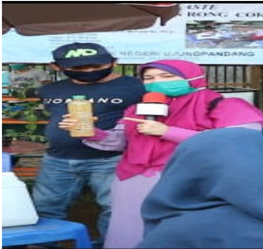
Gambar 3. Pemaparan Cara pembuatan MOL

Demosntrasi dimulai dengan pemaparan proses pembuatan MOL (Mikroorganisme Lokal) dengan menggunakan bahan-bahan lokal seperti air kelapa, air cucian beras, dan perasan air nanas yang ditambahkan dengan ragi. Adapun proses pemaparan pembuatan MOL dan hasil MOL ditunjukkan pada gambar 3 dan gambar 4.