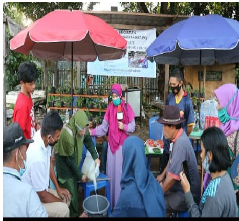
Gambar 7. Pencampuran nutrisi air kelapa