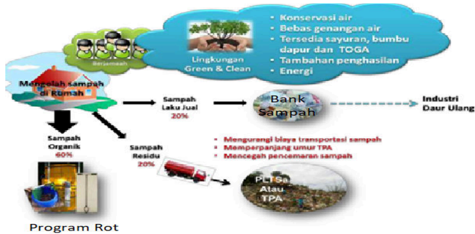
Gambar 1. Pola pengelolaan sampah berbasis individu

Pengelolaan dan pengolahan sampah padat dengan mengikuti pola pada gambar 1 menghasilkan sampah padat yang sampai ke TPA hanya sekitar 20%. Sementara sampah organik rumah tangga yang mencapai 60% dapat diolah melalui program 5R dengan perlakuan Rot ( R_5 ) atau pembusukan melalui proses pengomposan. Kegiatan PKM diupayakan untuk mensosialisasikan program 5R dan penerapan pengolahan sampah dengan paradigma baru yang mendukung program 5R untuk terwujudnya lingkungan zero waste . Adapun proses pengolahan sampah padat dengan paradigma baru dapat dilihat pada gambar 2.