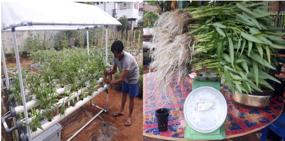
Gambar 12. Produk sayuran hidroponik (kangkung)

dengan waktu panen yang lebih cepat yaitu 14 hari dibandingkan secara konvensional (28-30 hari). Adapun hasil panen sayuran hidroponik dapat dilihat pada gambar 12.