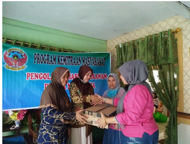
Gambar 3. Penyerahan peralatan kepada mitra