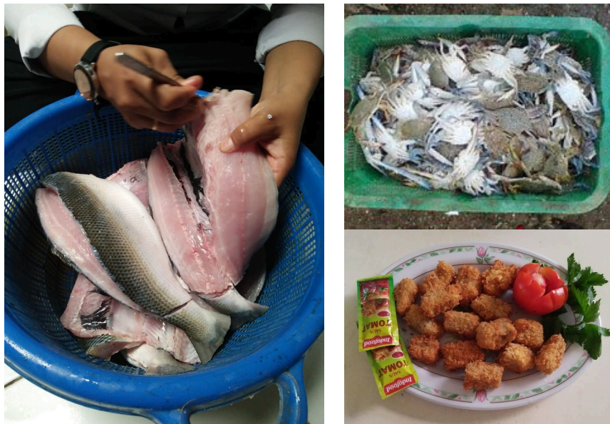
Gambar 2. Pencabutan duri ikan bandeng, rajungan, dan produk nugget

Selanjutnya peserta melakukan uji sensorik/organoleptik terhadap produk. Penyerahan peralatan pengolahan ikan kepada mitra dilakukan setelah kegiatan pelatihan berlangsung. Kegiatan tersebut dinilai cukup berhasil ditinjau dari antusias peserta dalam mengikuti setiap kegiatan, partisipasi aktif peserta selama kegiatan, serta harapan besar peserta untuk membuat usaha pengolahan ikan bandeng yang dilaksanakan secara berkelompok.