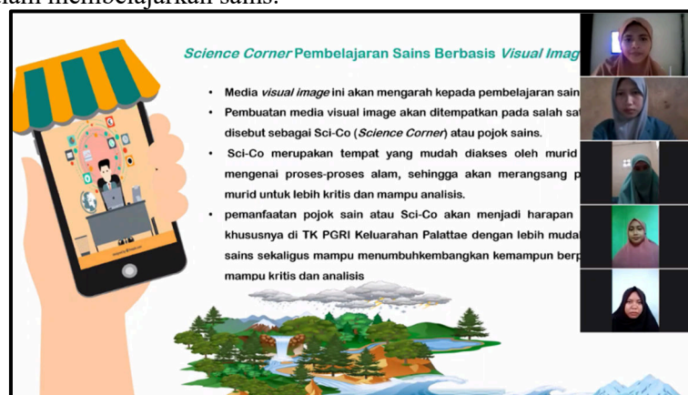
Gambar 3.1 Penyuluhan pada Mitra Secara Daring

Berdasarkan permasalahan mitra sekaitan dengan kurangnya alat bantu mengajarkan sains di TK menjadi salah satu urgensi masalah yang dihadapi mitra saat ini. Stimulus kemampuan dan pengembangan kognitif murid dimana pada level umur <5 tahun sangat membutuhkan rangsangan imajinasi dalam bentuk gambar dan warna bahkan suara. Jika hanya memaparkan sains dalam bentuk oral atau penjelasan guru, tentunya tidak berdampak besar bagi murid. Mitra menginginkan adanya alat bantu berupa alat peraga yang lebih interaktif berupa audio dan visual. Oleh karena itu, tahapan penyuluhan merupakan kunci persuasif tim kepada mitra yaitu guru TK PGRI Kelurahan Palattae dalam memperkenalkan Sci-Co sebagai salah satu alternatif jawaban atau solusi kepada mitra dalam membelajarkan sains.