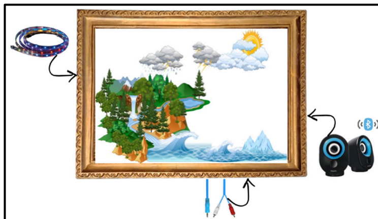
Gambar 3.2 Rancangan Desain Alat

Rancangan desain alat bantu Sci-Co diusahakan mampu diakses oleh perangkat handphone untuk memonitor audio dengan bantuan bluetooth , sehingga mitra mampu menggunakannya kapan saja tanpa membutuhkan akses online/daring . Meskipun demikian, untuk menjawab perkembangan pesatnya penggunaan daring dalam belajar, tim juga membuat Buku Panduan yang dapat diakses secara daring , yaitu booklet mengenai topik pembelajaran sains serta dapat pula diakses dengan buku digital interaktif yang jauh lebih menarik.