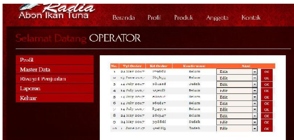
Gambar 8. Halaman Pemeriksaan Pesanan oleh Admin

Konsumen dapat mengklik kalimat “Saya Setuju Memesan Barang Tersebut” jika ingin melanjutkan transaksi sekaligus dapat memilih metode pembayaran yang telah dicantumkan pada halaman tersebut. Pihak operator seyogyanya rajin mengecek websitenya dan memastikan pemberian pelayanan terbaik bagi para anggota yang telah memesan produknya. Pengiriman produk sesegera mungkin dilakukan setiap ada pesanan yang telah dibayar.