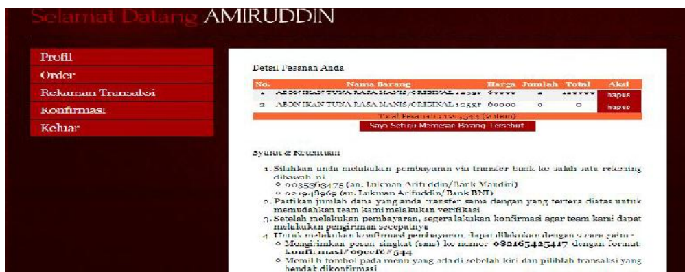
Gambar 7. Halaman Persetujuan Pembelian Produk

Penekanan tombol Bayar akan menghasilkan tampilan seperti berikut: