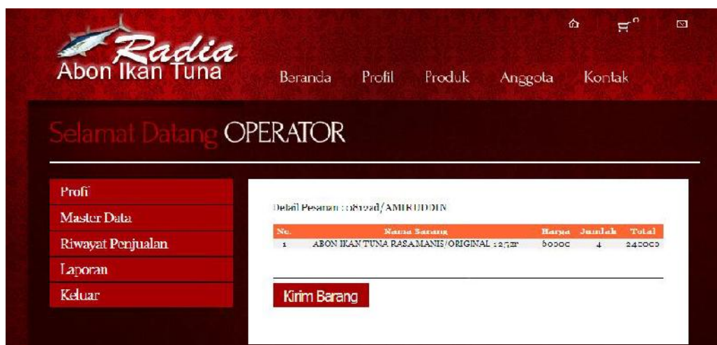
Gambar 9. Halaman Detail Pemesanan Anggota dan Pengiriman Barang