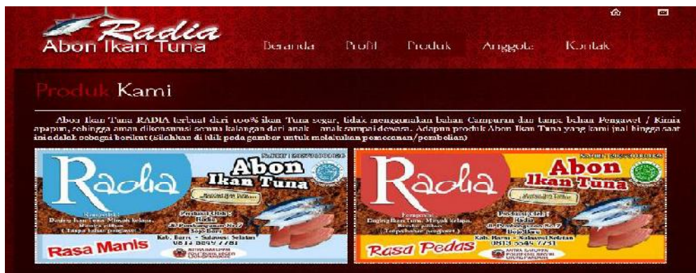
Gambar 5. Halaman Produk

Anggota dapat memilih produk yang diinginkan beserta jumlahnya. Setelah melakukan pemesanan, anggota dapat menekan tombol Order . Anggota dapat melakukan pemesanan barang lainnya lagi dan tekan kembali tombol Order .