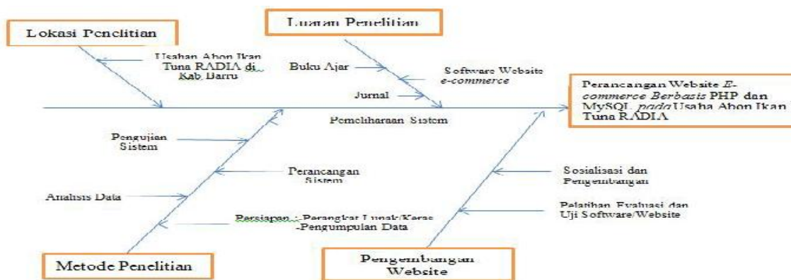
Gambar 1. Diagram Alir Penelitian

Tipe penelitian yang digunakan adalah penelitian terapan yaitu salah satu jenis penelitian yang bertujuan untuk memberikan solusi atas permasalahan tertentu secara praktis.