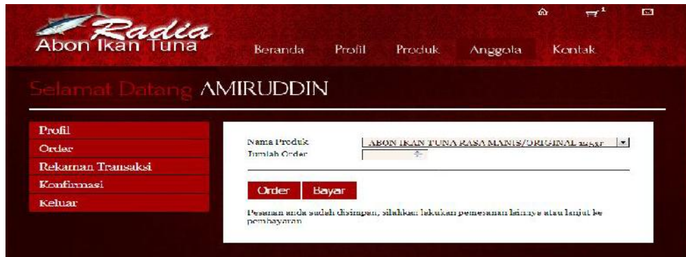
Gambar 6. Halaman Pemesanan Produk

Penekanan tombol Bayar akan menghasilkan tampilan seperti berikut: