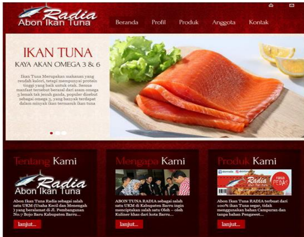
Gambar 4. Halaman User