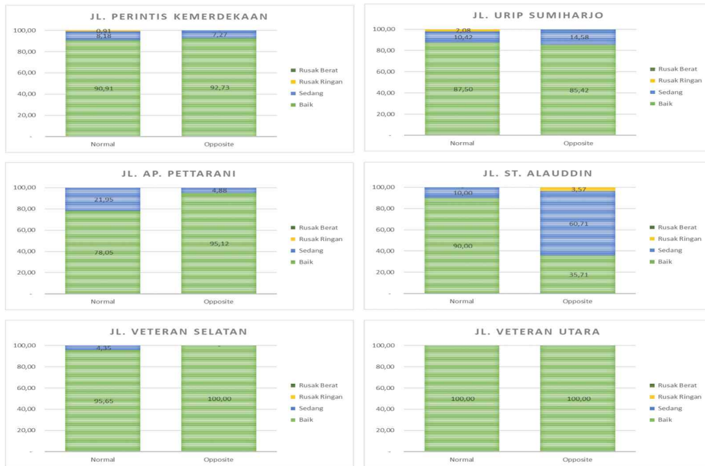
Gambar 3. Grafik Prosentase Kondisi jalan

Sesuai ketentuan dari Direktorat Jenderal Bina Marga menggunakan parameter International Roughness Index (IRI) dalam menentukan kondisi konstruksi jalan dan berdasarkan nilai eIRI yang diperoleh dari aplikasi Roadroid sebagaimana yang digambarkan pada Gambar 2 maka prosentase kondisi Jalan dari keanaman ruas jalan yang disurvei sebagaimana disajikan pada Gambar 3 berikut ini: