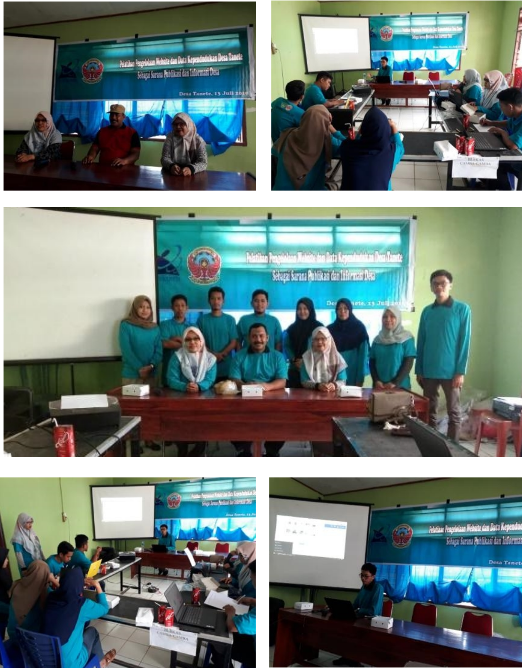
Gambar 4. Kegiatan Pelaksanaan Pelatihan

Pelaksanaan kegiatan diawali dengan pembukaan oleh Bapak Kepala Desa Tanete dan tim pengabdian. Setelah itu, dilaksanakan pelatihan yang diarahkan oleh tim. Peserta pelatihan terdiri atas 6 orang staf pemerintahan Desa Tanete. Gambar 4 menunjukkan foto-foto kegiatan pada saat pelatihan.