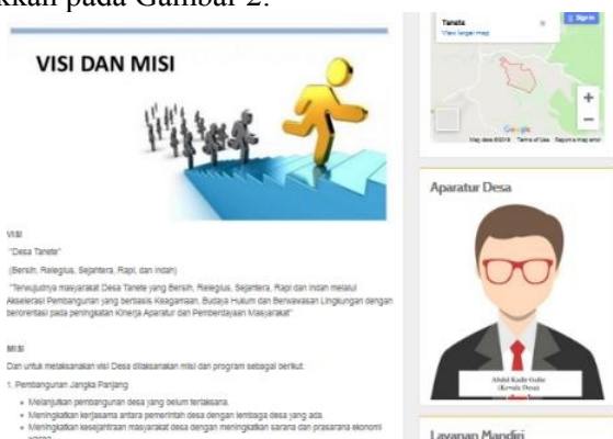
(a) Halaman Tentang

Sistem pengelolaan website desa yang digunakan berasal dari sistem yang telah dibangun oleh komunitas OPEN SID. Sistem ini memiliki banyak keunggulan antara lain sistem informasi desa, sistem data kependudukan dan sistem administrasi persuratan desa sesuai standar nasional. Beberapa tampilan dari sistem tersebut ditunjukkan pada Gambar 2.