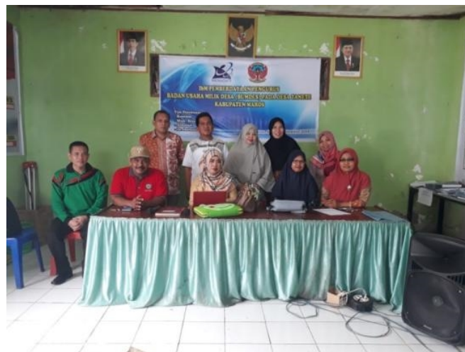
Gambar 3. Kegiatan Survei

Sebelum pelaksanaan pelatihan dilakukan kegiatan survey meliputi koordinasi antar sesama anggota tim pengabdian dan mitra. Koordinasi dengan tim pengabdian, dilakukan melalui aplikasi messenger dan dengan mitra melalui komunikasi suara melalui jaringan telepon seluler dan survey ke lokasi kegiatan. Sebelum pelaksanaan kegiatan, kami melakukan survey sinyal untuk komunikasi data terbaik pada lokasi mitra dengan membawa beberapa jenis dan type modem dengan kartu seluler dari berbagai operator.