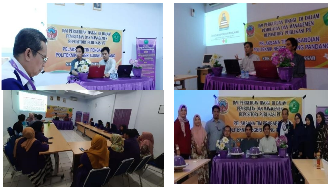
Gambar 3. Foto-foto kegiatan PKM