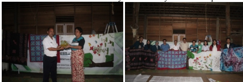
Gambar 7. Antusiasme pemerintah setempat dan masyarakat dalam pembuatan produk batik motif dayak