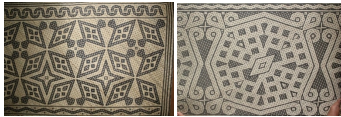
Gambar 4. Motif khas dayak

kerajinan dengan ciri khas motif Dayak Kampung Tende (Gambar 4). Kerajinan ini sudah banyak dikenal oleh masyarakat luas sebagai produk khas Kampung Tende. Oleh karena itu, tim pengabdian berinisiatif untuk memanfaatkan kekayaan alam yang ada di Kampung Tende sehingga bernilai tinggi dan mampu berperan meningkatkan dan menambah penghasilan masyarakat Kampung Tende.