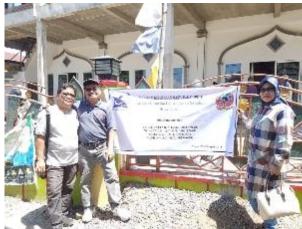
Gambar2 . Lokasi Kegiatan Pengabdian

Program ini akan dilaksanakan selama kurang lebih 8 bulan, termasuk evaluasi tingkat kemajuan dan penyusunan laporan dengan uraian kegiatan untuk rencana tahapan berikutnya .: