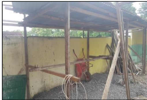
Gambar 2. Rencana lokasi untuk pembuatan sumur bor

Untuk mengatasi masalah masyarakat di dusun Tala-tala utamanya pada masjid Ihyaul Jama'ah adalah memanfaatkan air tanah sebagai sumber air. Banyak cara yang bisa digunakan untuk memperoleh air tanah, salah satunya adalah dengan membuat sumur baik itu sumur gali maupun sumur bor. Sumur bor sendiri memiliki keunggulan dibandingkan dengan sumur biasa, antara lain adalah kedalaman yang dicapai lebih maksimal serta kualitas airnya lebih baik sehingga membuat sumur bor menjadi pilihan yang paling efisien untuk memanfaatkan air tanah secara optimal dan mengatasi masalah kebutuhan air pada masjid Ihyaul Jama'ah dan masyarakat sekitarnya.