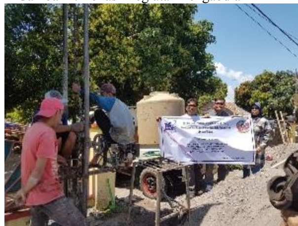
Gambar 3 . Pelaksanaan kegiatan pengabdian