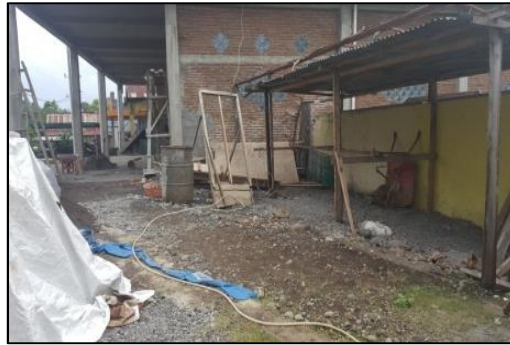
Gambar 1. Kondisi Masjid Saat ini