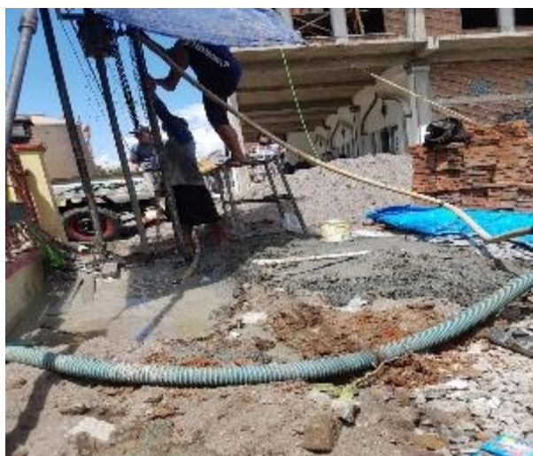
Gambar 4 . Pemasangan Sumur Bor