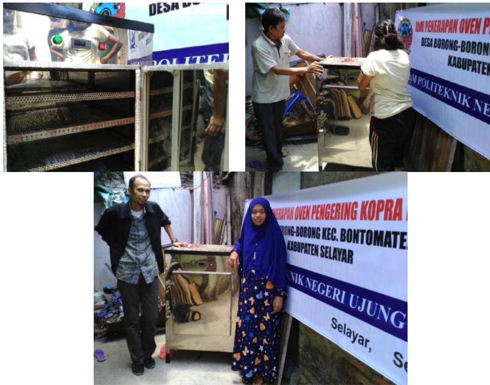
Gambar 3. Penjelasan cara penggunaan dan Penyerahan Oven Pengering kepada Mitra

pemilihan material, peralatan yang digunakan, pembuatan oven, cara pengoperasian sampai pada cara perawatan oven yang telah dibuat.