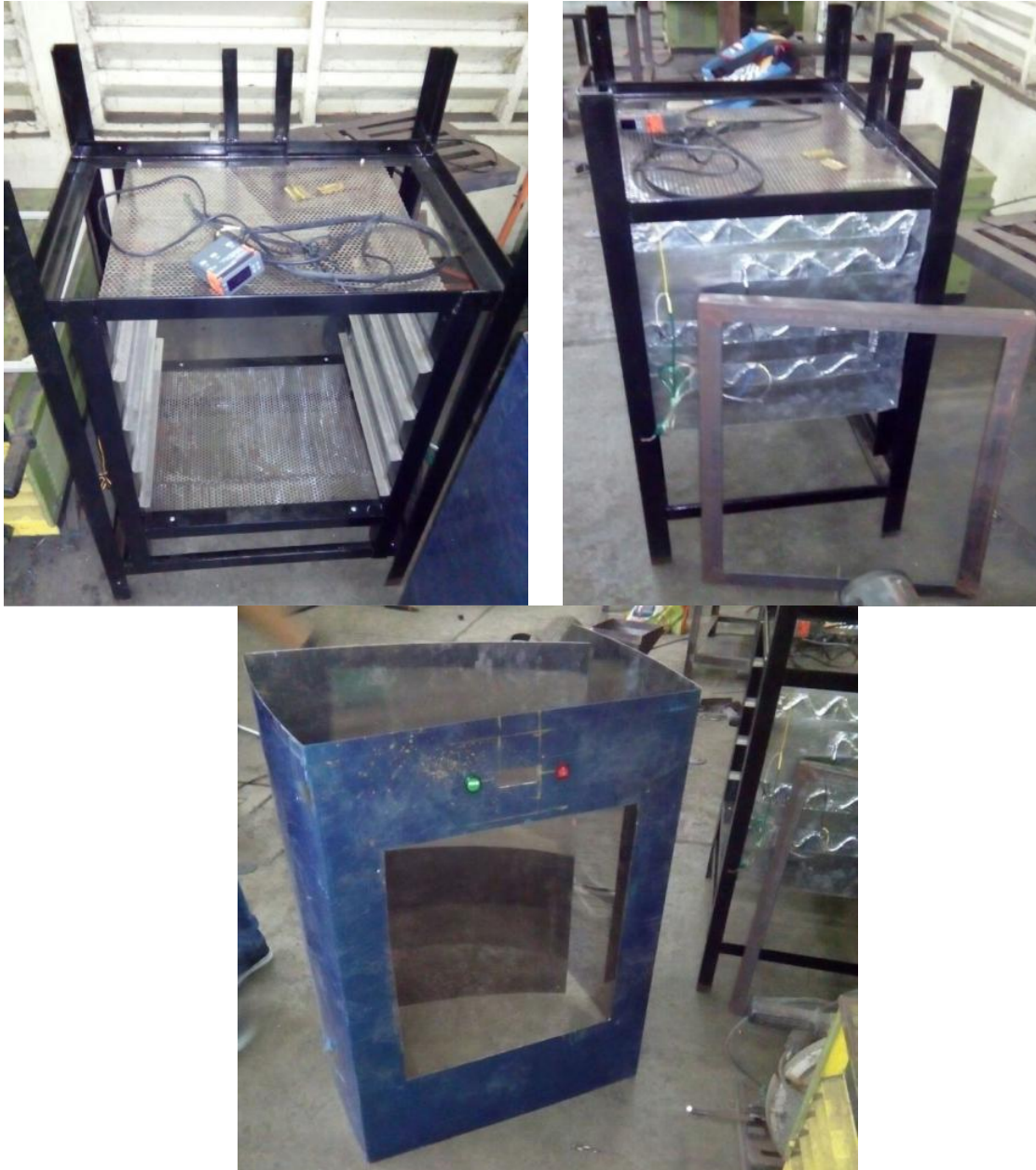
Gambar 2. Proses Pembuatan Oven Pengering Kopra