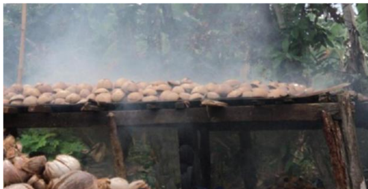
Gambar 1. Proses Pengasapan Kelapa Segar Menjadi Kopra Hitam

Pola manajemen yang dianut oleh kelompok usaha kopra “Sari Alang” masih bersifat manajemen kekeluargaan. Belum ada standar penggajian yang baku, pembagian hasil pengolahan koprapun hanya berdasar kesukarelaan dengan tetap mempertimbangkan kinerja yang dilakukan oleh masing-masing anggota keluarga. Berkaitan dengan pemasaran kopra, tidak ada masalah karena pedagang pengumpul banyak terdapat di daerah ibu kota kabupaten yang hanya berjarak kurang lebih 10 km dari lokasi