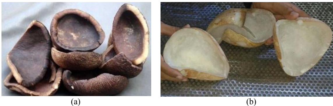
Gambar 5. Perbandingan Kopra hasil pengasapan (a) dan hasil pengovenan (b)

Kopra hasil pengovenan berwarna putih bersih dan tidak terdapat jamur. Harga kopra ini dipasaran umumnya 3X lebih tinggi dari pada kopra hitam.