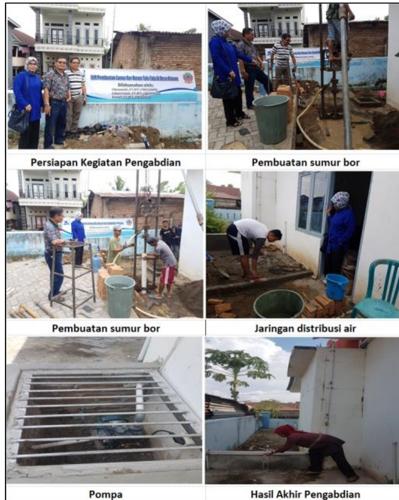
Gambar 2. Hasil Ipteks Yang Diterapkan