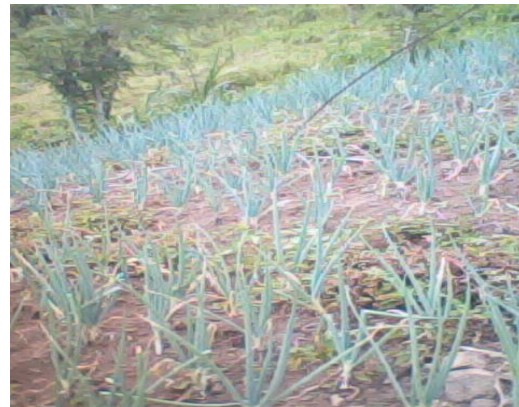
Gambar 2. Tanaman yang membutuhkan air

Luaran Kegiatan IbM ini ialah: (a) Sebuah pompa hidram dengan diameter 4 inci yang dapat mendistribusikan / mengangkat air dari bawah/mata air menuju kebun hortikultura dan palawija yang berada di atas bukit; (b) Sebuah bak reservoir intake; (c) Sebuah bak reservoir outtake; (d) Jaringan pipa in take dengan diameter 3 inci sepanjang 30 meter; (e) Jaringan pipa out take dengan diameter \frac{3}{4} inci sepanjang 500 meter; dan (f) Artikel ilmiah yang akan dipublikasikan di jurnal nasional.