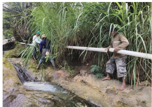
Gambar 3. Pompa dan pipa intake setelah terpasang