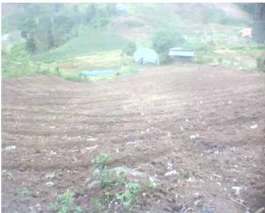
Gambar 1. Lahan siap ditanami

Berdasarkan analisis situasi, permasalahan yang disepakati bersama untuk diselesaikan ialah: (a) Pertumbuhan tanaman kurang subur karena kurangnya air untuk menyiram; (b) Sumber air atau aliran sungai jauh di bawah tebing; (c) Belum tersedianya aliran air yang secara permanen dapat mengairi tanaman hortikultura dan palawija yang berada di atas bukit; (d) Masyarakat masih harus naik turun bukit mengambil air untuk kebutuhan menyiram tanaman hortikultura dan palawija. Dengan tersedianya air di atas bukit lokasi kebun hortikultura dan palawija diharapkan dapat membawa dampak perubahan ekonomi. Karena lahan yang selama ini terlantar akan dapat dialiri air untuk kebutuhan kebun hortikultura dan palawija. Dengan demikian, ketersediaan air dapat memenuhi kebutuhan petani hortikultura dan palawija dan sebagian yang lainnya dapat memulai bercocok tanam.