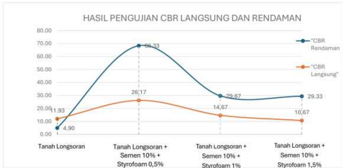
Gambar 2. Grafik Hasil Pengujian CBR Langsung dan Rendaman

Dari hasil pengujian CBR maka di dapatkan nilai peningkatan/penurunan nilai CBR Langsung dan CBR Rendaman sebagai berikut :