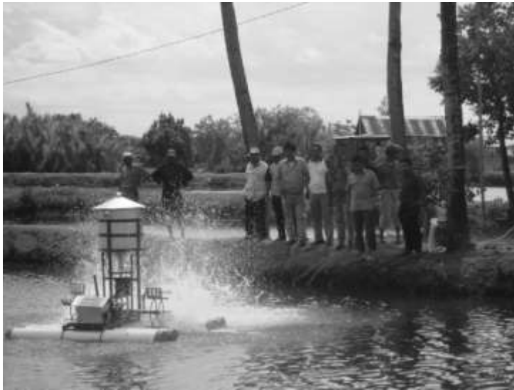
Gambar 6. Demonstrasi Alat