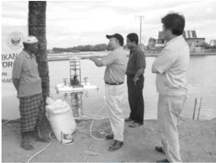
Gambar 8. Sosialisasi Alat