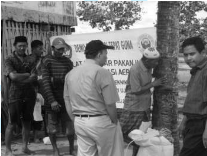
Gambar 7. Suasana Penyuluhan Alat