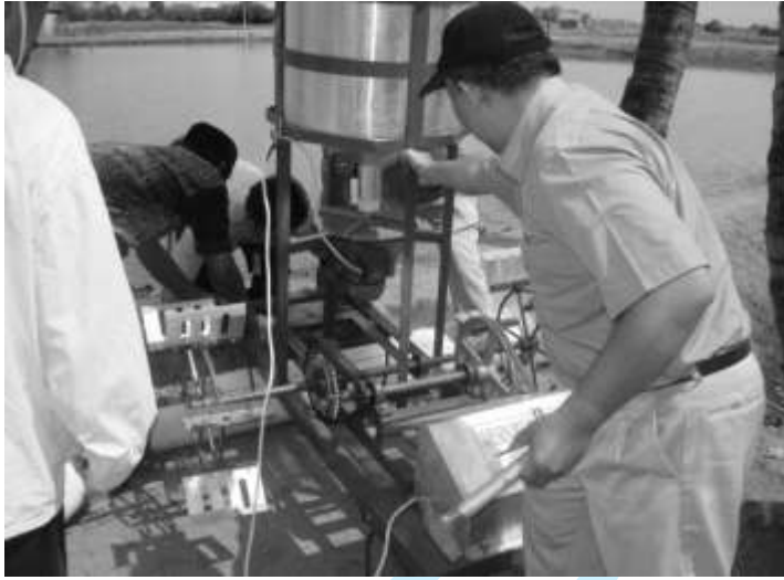
Gambar 4. Persiapan Demonstrasi Alat