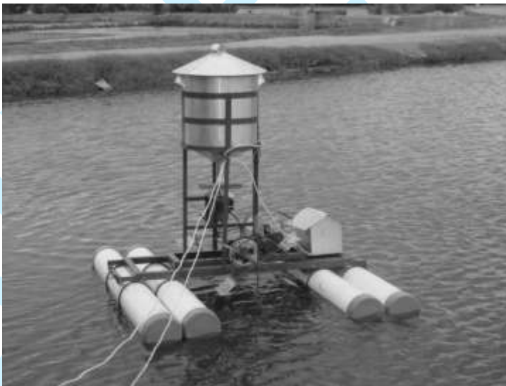
Gambar 3. Hasil Pengembangan Alat