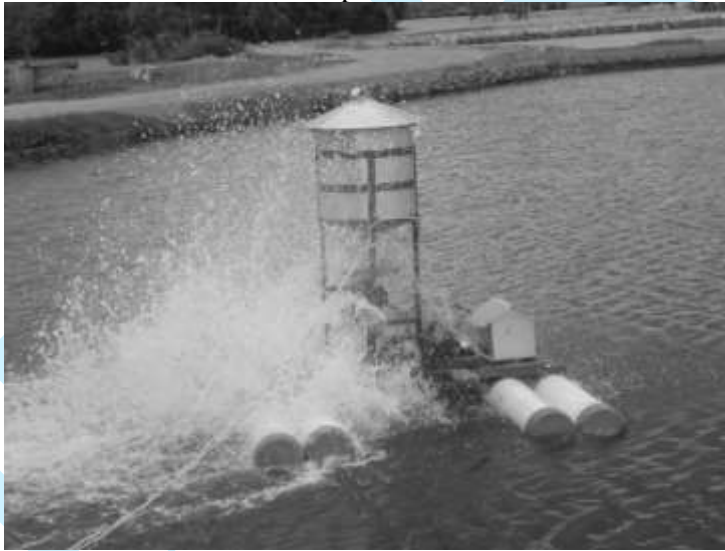
Gambar 5. Demonstrasi Alat