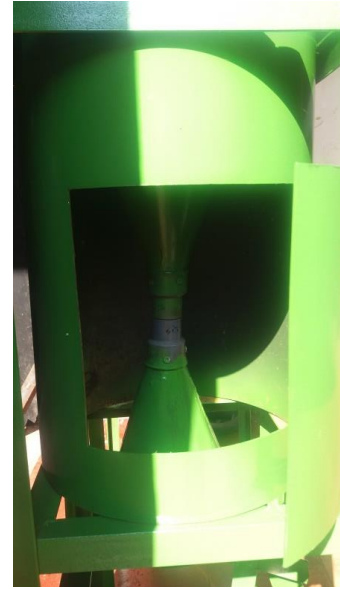
Gambar 6. Tabung ejektor

energi tekan yang dibutuhkan dalam penelitian ini seperti diperlihatkan pada gambar 6.