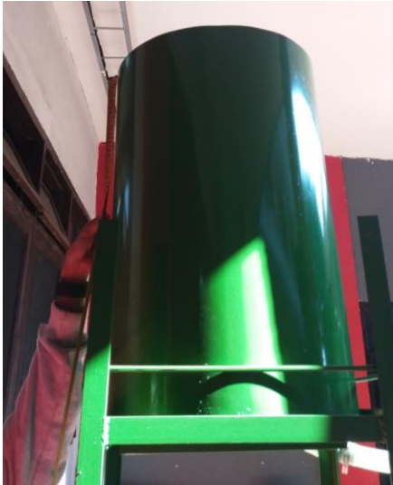
Gambar 5. Silinder