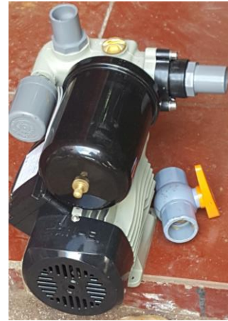
Gambar 2. Pompa air