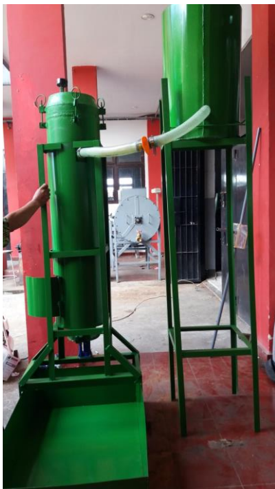
Gambar 7. Konstruksi alat eliminasi gas buang

Setelah semua elemen konstruksi yang telah didesain menurut ukuran masing masing maka dilakukanlah perakitan (assembling) dari semua elemen tersebut sehingga membentuk suatu unit konstruksi, berupa mesin eliminasi emisi gas buang pencemaran udara atmosfer seperti diperlihatkan gambar 7.