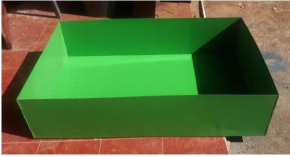
Gambar 4. Reservoir