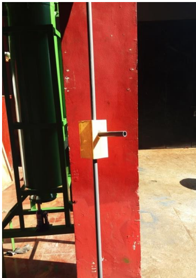
Gambar 7. Pipa paralon