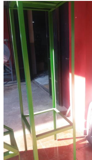
Gambar 3. Tiang penyangga